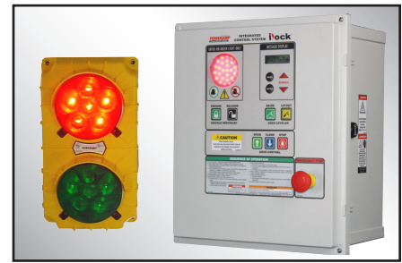
iDock Controls incluyen comunicación por luces y que se pueden integrar con cualquier otro equipo de andén.