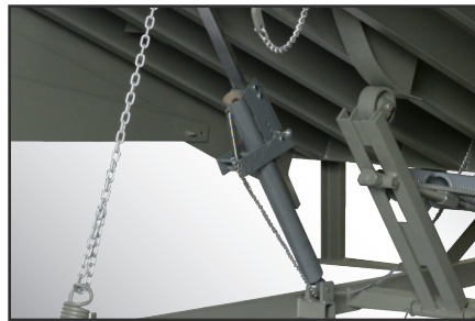
Mecanismo de sujeción del tambor de oscilación, margen extendido y para servicio pesado.