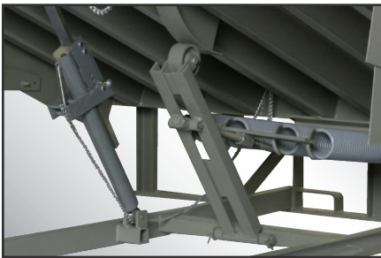
El conjunto equilibrador Cam Control permite que la rampa se extienda suavemente y que el nivelador baje fácilmente.