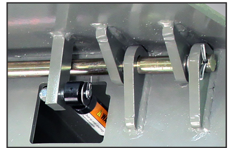
Plataforma de "construcción de caja" con un diseño de bisagra tipo orejeta para servicio pesado.