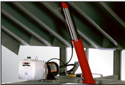
Depósito hidráulico translúcido.