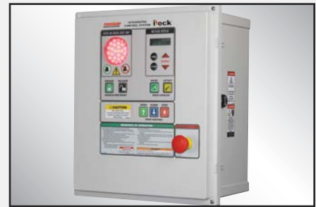
iDock Controls mejorados opcionales con pantalla de mensajes interactiva y que se pueden integrar con cualquier otro equipo de andén.