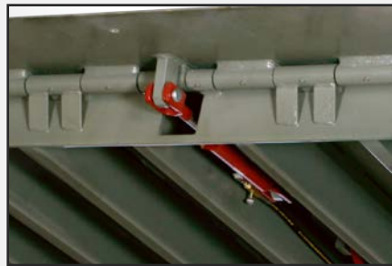
Cilindro flexible de reborde completamente hidráulico.